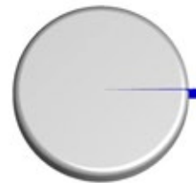
Carica batterica totale

■ 0,1909% PATOGENI ■ 99,8131% SAPROFITI CARICA BATTERICA TOTALE 100% ■ + ■