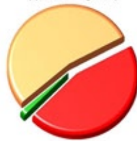
Percentuali relative alla carica dei patogeni (Specchio blu del grafico 1)

■ 45,1619% Complesso Rosso ■ 53,4555% Complesso Arancione ■ 1,3826% Complesso Verde