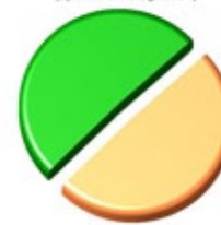
Percentuali relative alla carica dei patogeni (Specchio blu del grafico 1)

■ 0,0000% Complesso Rosso ■ 49,1926% Complesso Arancione ■ 50,8074% Complesso Verde