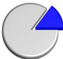
Carica batterica totale

■ 14,9345% PATOGENI ■ 85,0655% SAPROFITI CARICA BATTERICA TOTALE 100% ■ + ■